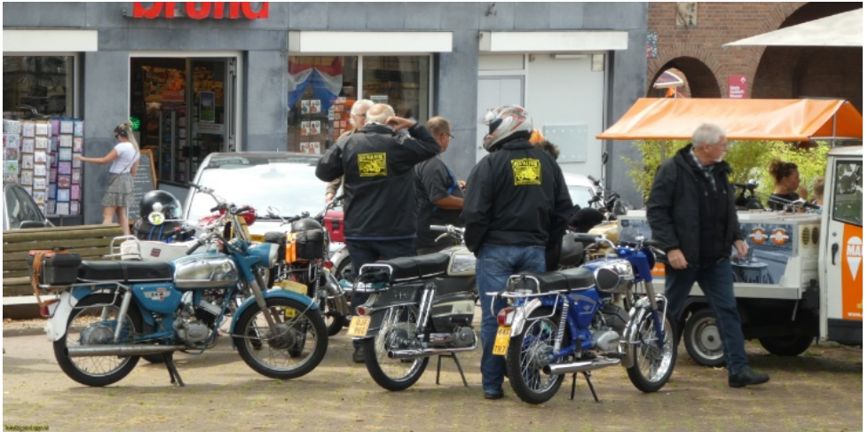
Lunchpauze in Rhenen

In de andere ruimte troffen we een bijna even grote verzameling aan, ook veel Hollands, maar ook stonden er fabricaten uit andere landen. Te veel om op te noemen eigenlijk.