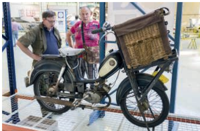
De ongerestaureerde Batavus Bilonet van de slagersjongen verdient ook een vermelding in het NRME

Het NRME is niet van de FEHAC maar van de stichting Mobiele Collectie