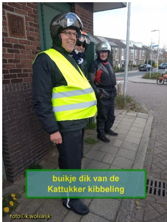
buikje dik van de Kattukker kibbeling

Netjes geserveerd op een bord, met bakje saus, wat salade en een schaalje friet. Was heerlijk en jammer te veel. Moest toch wat laten staan. Met een prima kopje koffie was het een zeer aangename onderbreking van de rit.